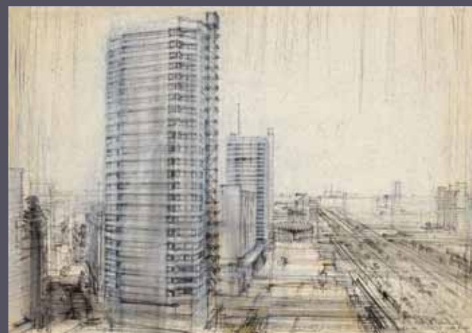
Warszawa - ul. Marszałkowska, Ściana Wschodnia, panorama, 1964 tuszu czarnym, kredka/karton; 70 x 100 cm