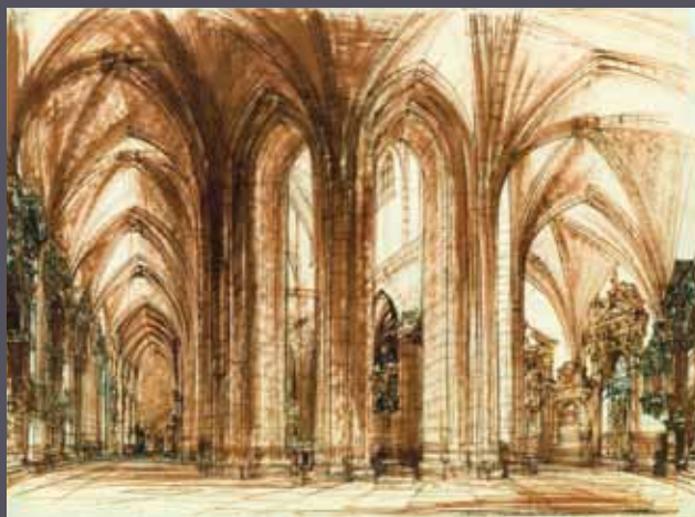
Gniezno - wnętrze katedry, 1960; tusz (sepia) /karton; 47 x 65 cm