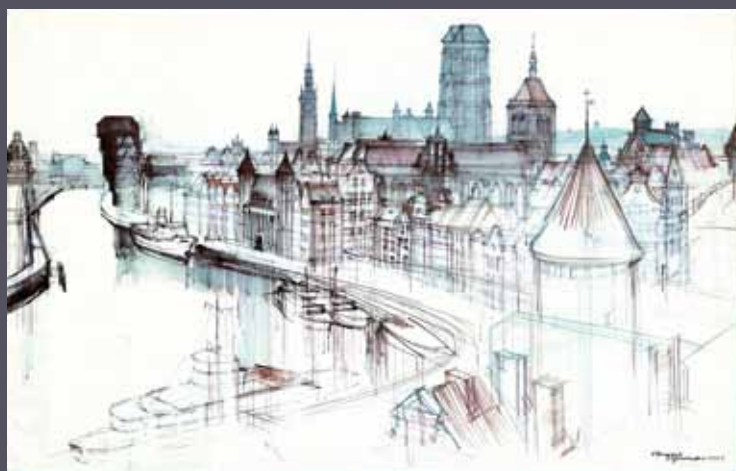
Gdańsk - panorama, 1975; tusz/akwarela/karton; 54 x 86 cm