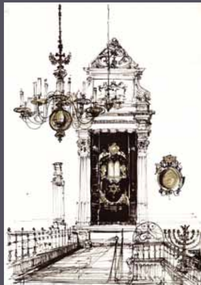
Kraków - wnętrze synagogi, 1986 tuszu czarnym, złocenia/karton; 70 x 50 cm

Prace artysty znajdują się w wielu kolekcjach prywatnych i instytucjonalnych. Były również publikowane w licznych wydawnictwach. Profesor Henryk Dąbrowski przez znawców rysunku bywa określany „polskim Piranesim”.