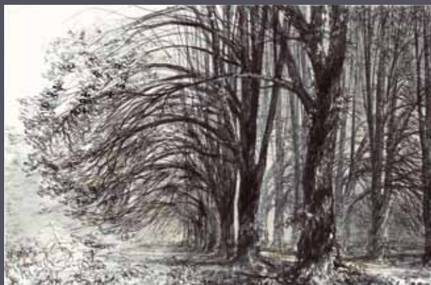
Podębie na Mazowszu - aleja lipowa, 1966/2011; giclée/papier; 52 x 79 cm

Prócz prezentowanych na wystawie, w naszej ofercie mamy giclée przeszło 100 dzieł artysty. Wkrótce wybór prac zostanie znacznie poszerzony.