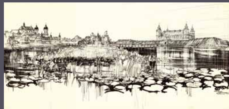
Tykocin - panorama, 1975; tusz czarny/karton; 48 x 100 cm