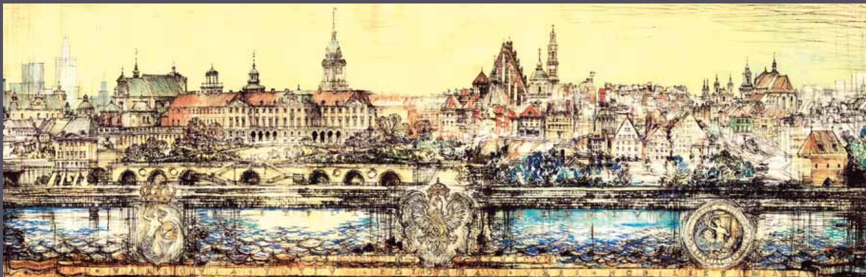
Warszawa – panorama z herbami, 1995; giclée/papier; 25 x 79 cm

Prace profesora pokazują architekturę realnie, oddając zarazem aurę, a niejednokrotnie i wizję jej dawnej świetności. Szczególnie interesujące są rozbudowane panoramy polskich miast – Warszawy, Gdańska, czy Torunia. Utrzymane w nastroju vedut dawnych mistrzów dzieła prezentują widok trwającego przez wieki grodu, a jednocześnie pulsującej nowoczesnością aglomeracji.