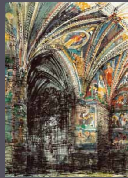
Kraków - Wawel, wnętrze katedry, 1958 akwarela, tusz/karton; 60 x 43 cm