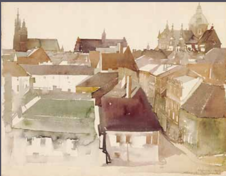
Kraków - ul. Kanonicza, widok z Wawelu, 1960; akwarela/karton; 45 x 58 cm