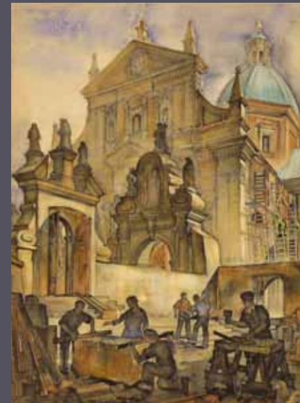
Kraków - kościół św. Piotra i Pawła, 1951 giclée/papier; 66 x 49 cm