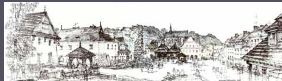
Kazimierz Dolny - panorama rynku, 1985; giclée/papier; 43 x 153 cm