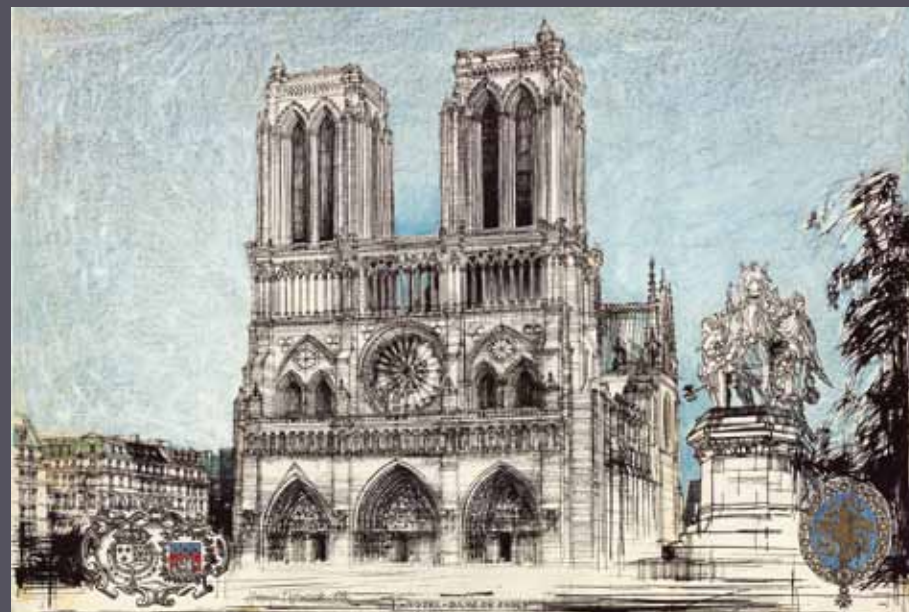
Paryż - katedra Notre-Dame, 1980; tusz, kredka/karton; 70 x 100 cm